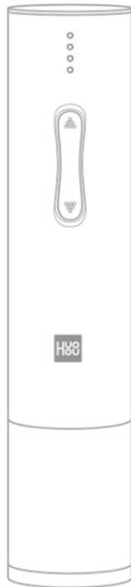
Abridor de vinhos