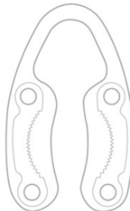
Cortador de papel