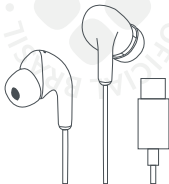
Fones de ouvido com Fio USB-C Xiaomi

Este manual se aplica apenas aos produtos importados e distribuídos no território brasileiro pela DL Comércio e Indústria de Produtos Eletrônicos Ltda. (DL) , distribuidora reconhecida como oficial pela XIAOMI Corporation.