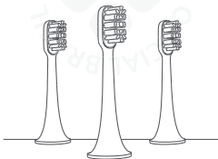
Refil para Escova de Dente Elétrica Mi Electric Toothbrush T100

⚠ Leia este manual cuidadosamente antes de usar o produto e guarde-o para futuras referências.