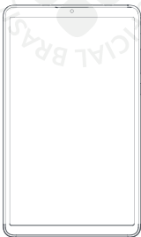
Tablet Redmi Pad SE 8.7"

Este manual se aplica apenas aos produtos importados e distribuídos no território brasileiro pela DL Comércio e Indústria de Produtos Eletrônicos Ltda. (DL) , distribuidora reconhecida como oficial pela XIAOMI Corporation.