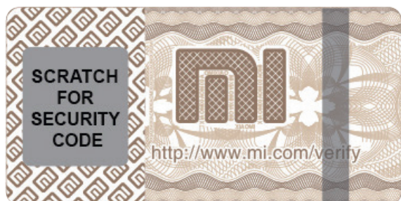
Etiqueta anti falsificação.

Cada Mi Power Bank, vem com uma etiqueta de anti falsificação na parte externa do pacote. Raspe o revestimento e vá para o site http://www.mi.com/verify para verificar a autenticação.