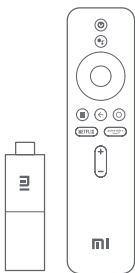
Mi TV Stick

⚠️ Leia este manual cuidadosamente antes de usar o produto e guarde-o para futuras referências.