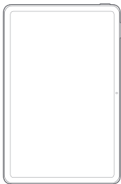
Tablet Redmi Pad SE

⚠ Leia cuidadosamente este manual antes do primeiro uso e guarde para referências futuras.