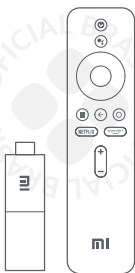
Mi TV Stick

⚠️ Leia este manual cuidadosamente antes de usar o produto e guarde-o para futuras referências.