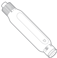
Chave de Fenda Catraca Xiaomi com 16 ponteiros

⚠ Leia este manual cuidadosamente antes de usar o produto e guarde-o para futuras referências.