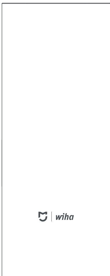
Case de armazenamento em liga de alumínio com magnetismo